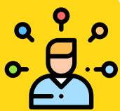
Tabla 1. Área de Matemáticas